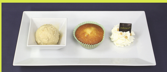
(Gleiches in zwei verschiedenen Kleidern)