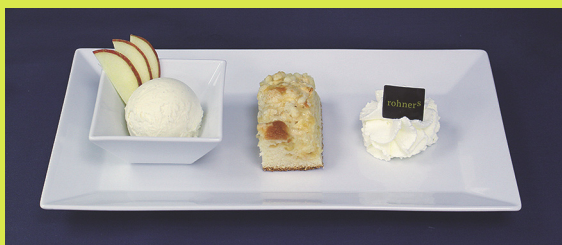
(Verschieden und doch gehören sie zusammen)