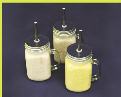
Frappé 1 Kugel nach Wahl Fr. 8.50