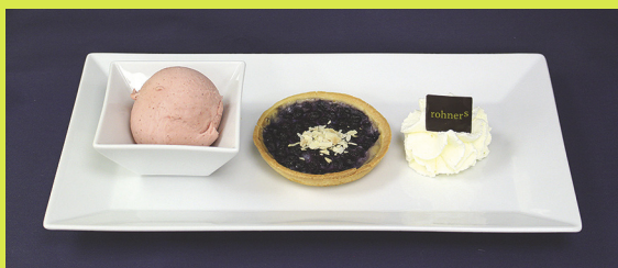
(Baby und Johnny)