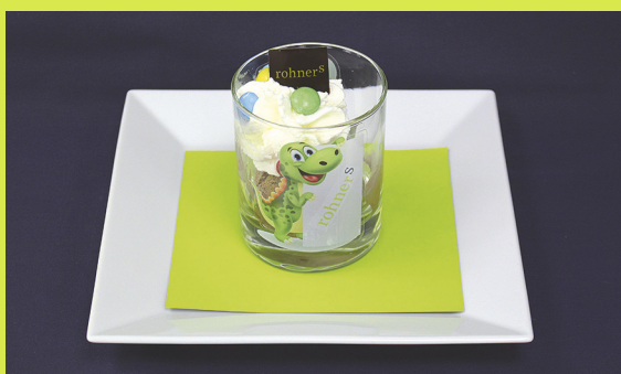
Mühlessie 1 Kugel nach Wahl inkl. Rohners Mühlessie Glas Fr. 8.50