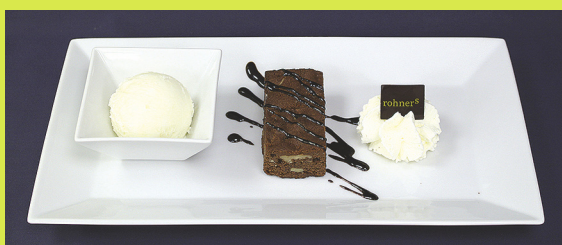
(Der weisse und der schwarze Schwan)