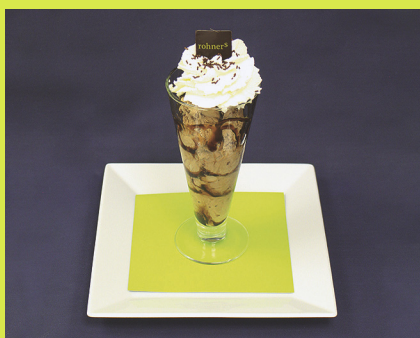
Eiskaffee Fr. 10.50